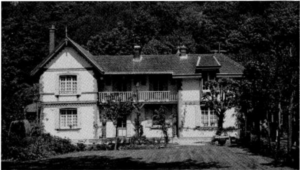
Etretat - La Guillette